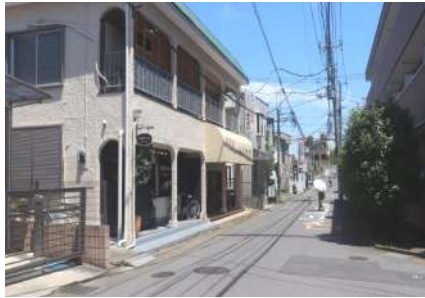
我孫子四丁目の商店街

6号線を横断する「天子山地下歩道」を抜けると、つくし野一丁目です。6号線を東に向かい久寺