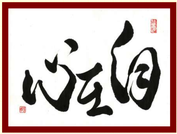
「自在心」 禅語 束縛のない思いのままの心