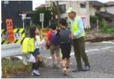
通学児童の安全確認を

踏切は学校から300mほどの成田線の二本榎踏切です。「夏の暑さもあるが、特に冬の風吹く朝に1時間以上立ち続けるのは辛い