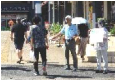
マイナンバーカード見直しも訴え

が、子どもたちを見て頑張れる」と話されています。うかがった7月5日、この日の通学児童は約70名でした。平和への思いを語る船橋さん