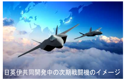
日英伊共同開発中の次期戦闘機のイメージ

実際、防衛費（軍事費）を5年間で43兆円に増やすという計画は実施に移され、24年の防衛予算は以前の5兆円超だったものを約8兆円に増やしました。3月27日の新聞各紙は「次期戦闘機輸出解禁 政府決定 安保政策を転換」（朝日）などと一面トップや社説で取り上げるなどしました。読売、産経、日経は無批判で報道。そして