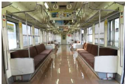
3扉ロングシート車内

これら状況を考慮に入れて、1980年代初頭に通勤時間帯の乗車率が250%に達していた常磐線中距離電車の取り替え用でロングシートが試行されるこ