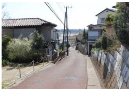
手賀沼に下りる坂道

最大の方後田墳です。戻り、2又を上り、道なりに歩くと「水神山古墳」で、4世紀後半の東葛地域