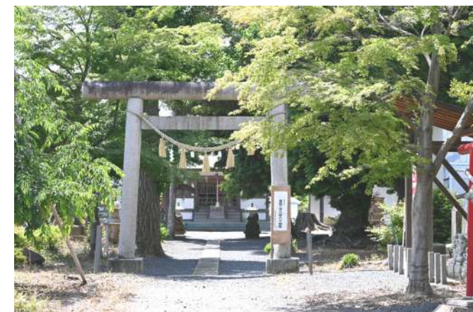
境内にある最古の石造物は勢至菩薩(せいしぼさつ)で、延宝九(1861)年辛酉(しんゆう)九月二十三日の年紀が記されている。現在の社殿は大正十五年建立のため、平成十六年十二月に再建されています。伝統行事の元朝詣りでは、初詣客に甘酒が振る舞われ、その行列は境内からあふれるほど賑わいを見せています。このすぐ近くに中里市民の森があります。自然のままの森が残され、四季を通じて散策を

※法律相談(相談無料)・岩井事務所にて毎月第4木曜日(2時~4時)開催しています(事前に「」ご連絡ください)047-188-2141