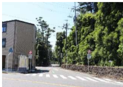
日立アカデミーの緑