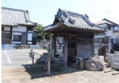
最勝院・第27番札所

「我孫子中」の校庭では古墳が発掘されています。その他にも古墳・遺跡は高野山のはほぼ全小字に分布しているといえます。昔からここは住みやすい地域だったことがわかります。