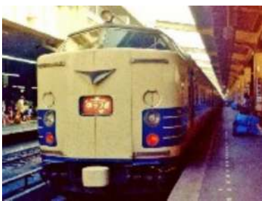
583系寝台特急「ゆうづる」

この一往復増のために充てられた車両は、ダイヤ改正でディーゼル特急から電車特急に替わった「はつかり」と同じ新型車両(583系)でした。といっても「ゆうづる」から寝台車がなくなった訳ではなく、一編成13両のうち、1等車(現グリーン車)と食堂車以外の11両は全て2等寝台車(現B寝台車)・普通車の寝台車)で、寝台専用とも