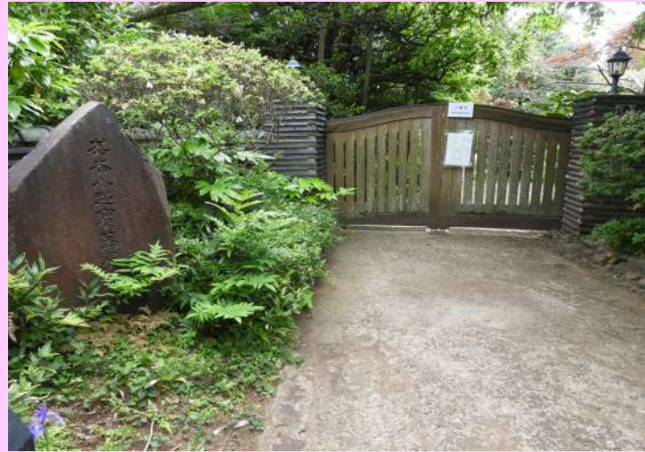
側(里)に続く「ハケの道」や手賀沼の湖上を驚きました。(里)

我孫子駅南口から徒歩約30分(1700m)。船戸の森入り口前には手賀沼へ降りる緩やかな坂があります。その坂の西側に屋敷跡(写真)があります。現在、屋敷跡に残る建物には、大正時代の建物を模して戦後建てられたものです。庭から斜面の景色と相まって、当時の我孫子をしのぶことができ、数少ない場所と紹介されています。実篤は住んでいた約2年白樺派の家志賀直哉とは、敷地南 には「新しき村」の発会式をここで執り行い、宮崎県日向へ旅立っていった。現在、屋敷跡に残る建物は、大正時代の建物を模して戦後建てられたものです。庭から斜面の景色と相まって、当時の我孫子をしのぶことができ、数少ない場所と紹介されています。実篤は住んでいた約2年白樺派の家志賀直哉とは、敷地南