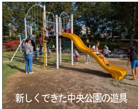
新しくできた中央公園の遊具