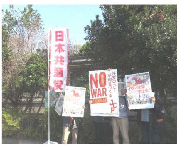
4月17日の新木駅での早朝宣伝活動

日本共産党我孫子東後援会は、4月13日布佐駅で、4月17日は新木駅で「アメリカ・イスラエルはイラン攻撃やめろ!」「戦争反対!」とコール行動をしました。また、4月17日に天王